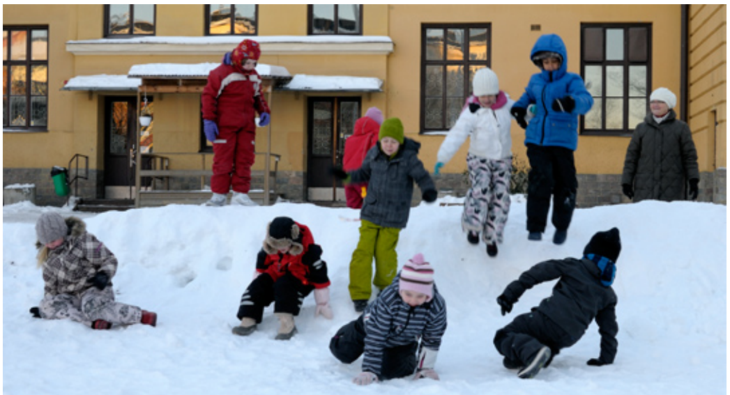
Eskilstunan ruotsinsuomalaisen koulun, Erkki-koulun oppilaita välitunnilla

Muissa esikouluissa lapsella on oikeus saada ns. äidinkielen tukea, ja kunnallisessa peruskoulussa ja joillakin paikkakunnilla myös lukiokoulussa järjestetään äidinkielenopetusta. Peruskoulussa tätä opetusta voi saada, vaikka kotona ei päivittäin käytettäisikään suomea ja vaikka kunnassa olisi vain yksi tätä opetusta haluava oppilas. Hänellä täytyy kuitenkin nykyisten sääntöjen mukaan olla jonkinlaiset suomen kielen perustaidot. Suomea voi opiskella myös vieraana kielenä joissakin lukiokouluissa. Ruotsinsuomalaisissa vapaakouluissa annetaan sekä suomen- että ruotsinkielistä opetusta, ja yleensä vapaakoulujen yhteydessä toimii myös ruotsinsuomalainen esikoulu.