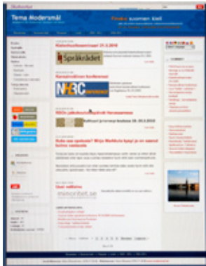
Tema Modersmål modersmal.skolverket.se/finska

Ruotsissa esikoulun ja koulun tulee antaa vanhemmille tietoa mahdollisuudesta äidinkielen tukeen ja -opetukseen, mutta tiedotus asiasta saattaa olla sattumanvaraista eikä se aina saavuta ruotsinsuomalaisia perheitä. Viisainta onkin hankkia itse aktiivisesti tietoa ja levittää sitä. Tietoa pitää olla saatavilla siellä, missä ruotsinsuomalaiset kokoontuvat ja mistä muutenkin on saatavilla tietoa heitä koskevista asioista. Kokoontumispaikoissa, esim. juttutuovissa (ks. sivu 28) on oltava tarjolla tietoa kaksikielisyyskasvatuksesta, kielen ja identiteetin välisistä yhteyksistä ja vähemmistökielistä.