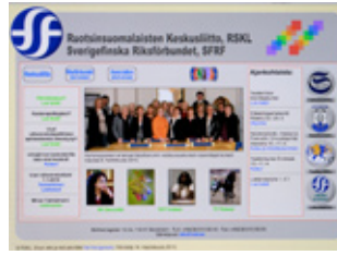
Ruotsinsuomalaisten Keskusliitto www.rskl.se