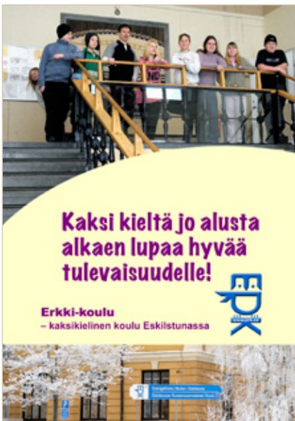
Eskilstunalaisen Erkki-koulun esitteen kansi

Omakielinen tai kaksikielinen esikoulu ja kouluopetus ovat välttämättömiä, jos lapsista halutaan korkeatasoisesti kaksikielisiä. Kodin tuki on kielikasvatuksessa tärkeä, mutta se ei yksin riitä takaamaan lapsen kaksikielisyyttä. Kaksikielisyyskasvatukseen tarvitaan ainakin kolme tahoja, esikoulu, koulu ja koti, joiden on kasvatustyössä tuettava toisiaan.