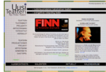
Uusi Teatteri www.uusiteatteri.se