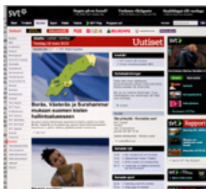
SVT Uutiset svt.se/utiset