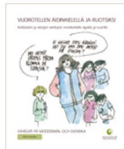
Vuorotellen äidinkielellä ja ruotsiksi www.skolverket.se

Hyvinkin erityyppisille perheille on tarjolla informaatiota. Verkossa on useitakin kaksi- ja useampikielisille vanhemmille tarkoitettuja sähköpostilistoja, joiden kautta saa neuvoja ja yhteyksiä muihin vanhempiin. Tällaisia ovat esimerkiksi babels-torn , ja suomenkielisten oma Ruotsinmammatt . Englanninkielisessä pape-rilehdessä Bilingual Family Newsletter on mielenkiintoista luettavaa kaksikielisille perheille. Sverigekontakt -lehdessä on vuodesta 2000 lähtien ollut erityinen palsta, jossa käsitellään monikielisten perheitten tilannetta ja jonne lukijat voivat