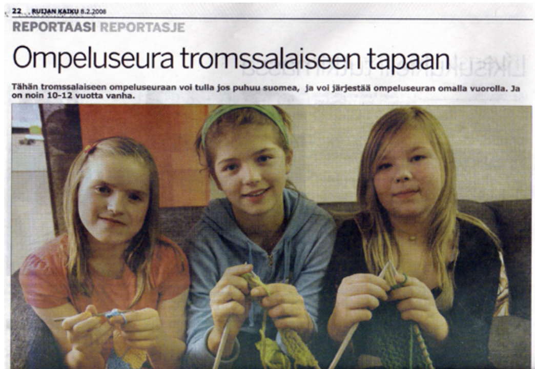
Tromssan pikkutyöt suomenkielisessä ompelukerhossaan (Ruijan Kaiku)

On selvää, että juttutupa-tyyppinen toiminta on paljolti vapaaehtoisten voimien varassa. Projektiluontoiseen pilottikokeiluun voi hakea rahoitusta, mutta lopullisena tavoitteena tulisi olla pysyvien juttutupien luominen. Kaikella mitä teemme pitää olla jatkuvuutta, koska kielen säilytys ei ole väliaikainen projekti vaan jatkuva prosessi, eikä kieli säily ilman pitkäjänteisyyttä.