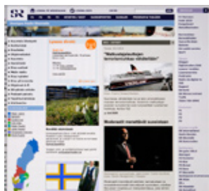
SR Sisuradio www.sr.se/Sisuradio

Nykyisen vähemmistöpolitiikan mukaan viestimillä on velvollisuus huolehtia siitä, että vähemmistöt saavat osansa radion ja television ohjelmatarjonnasta. Ruotsinsuomalaisia ohjelmia seurataan tutkimusten mukaan ahkerasti, mutta on myös tärkeää, että ohjelmien tekijöille annetaan palautetta. Ruotsinsuomalaisten järjestöjen on myös reagoitava, jos suomenkielistä ohjelmatarjontaa vähennetään.