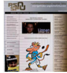
Ruotsinsuomalaisten nuorten liitto www.rsn.nu