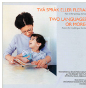
Kaksi tai useampia kieliä? Neuvoja monikielisille perheille modersmal.skolverket.se