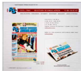
Ruotsin Suomalainen www.ruotsinsuomalainen.com