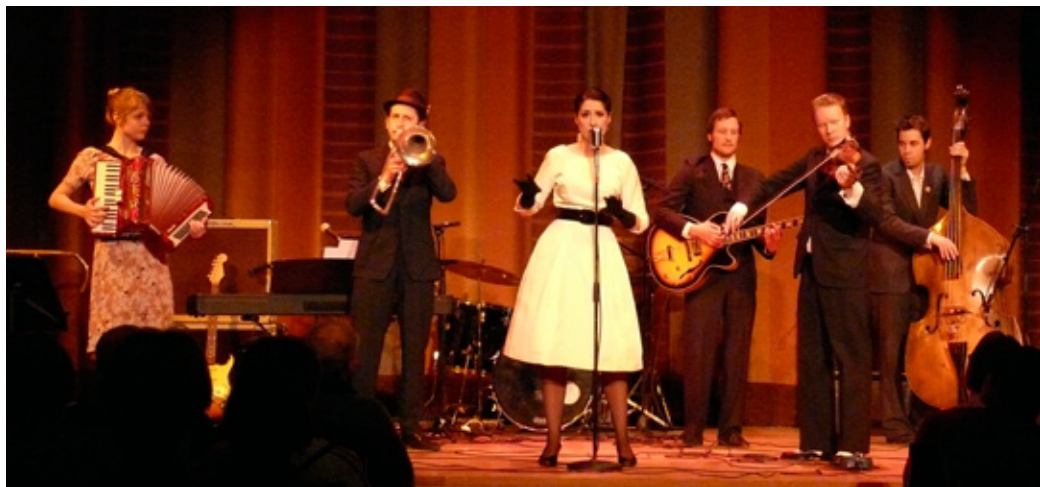
Darya ja Kuutamoo-orkkesteri