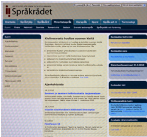
Kielineuvoston suomenkielinen kotisivu www.sprakradet.se/suomi

mii Kielen ja kansanperinteen tutkimuslaitoksen (Institutet för språk och folkminnen, SOFI) alaisena. Siihen kuuluu mm. ruotsin, suomen, meänkielen, jiddišin, romanin ja viittomakielen huolto, mikä vahvistaa osaltaan Ruotsin kielten moninaisuutta tukevaa kansallista kielipolitiikkaa. Kielineuvoston suomen kielen huoltajat antavat neuvoja kielikysymyksissä, laativat eri alojen sanalistoja ja huoltavat suomen kieltä Ruotsissa.