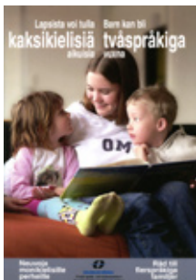
Lapsista voi tulla kaksikielisiä aikuisia Suomen kielen ja kulttuurin keskus

Nykyään on saatavilla paljon tietoa kaksikielisyydestä ja oman alkuperäiskielen merkityksestä. On olemassa ruotsinsuomalaisille ja muille kansallisille vähemmistöille sekä maahanmuuttajille tarkoitettuja opaslehtisiä, kirjoja ja verkkosivuitteita.